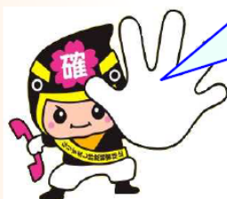
カクニンジャー福くん

そうならないためにも、留守番電話機能や防犯機能付き電話機器（通話自動録音機等）を活用し、詐欺被害を防ぎましょう！